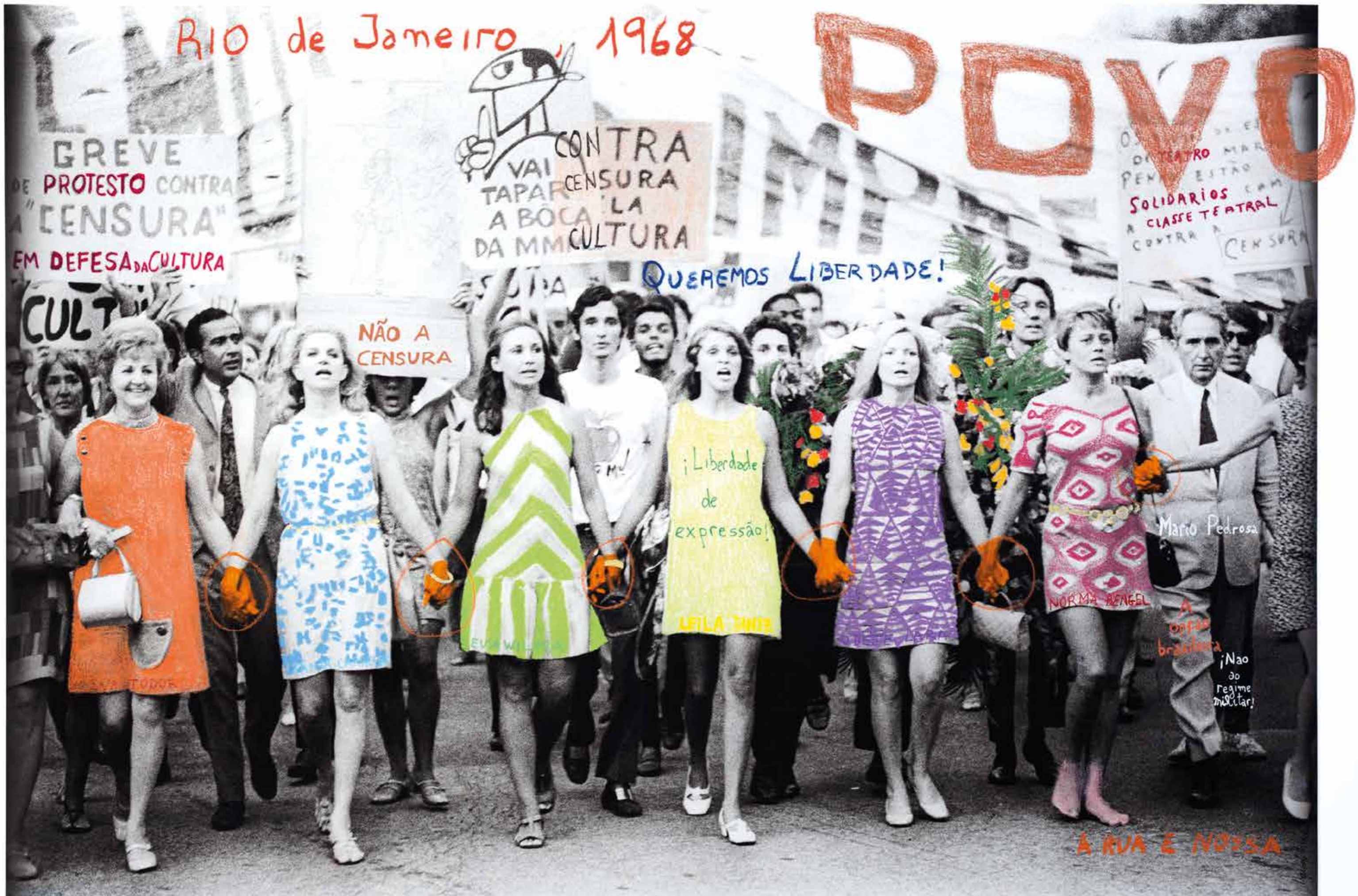
Artistas de teatro na greve contra a censura em 1968 na Baía de Guanabara, R.J. A ditadura censura as obras consideradas "políticas". RJ 1968 o fogo das ideias