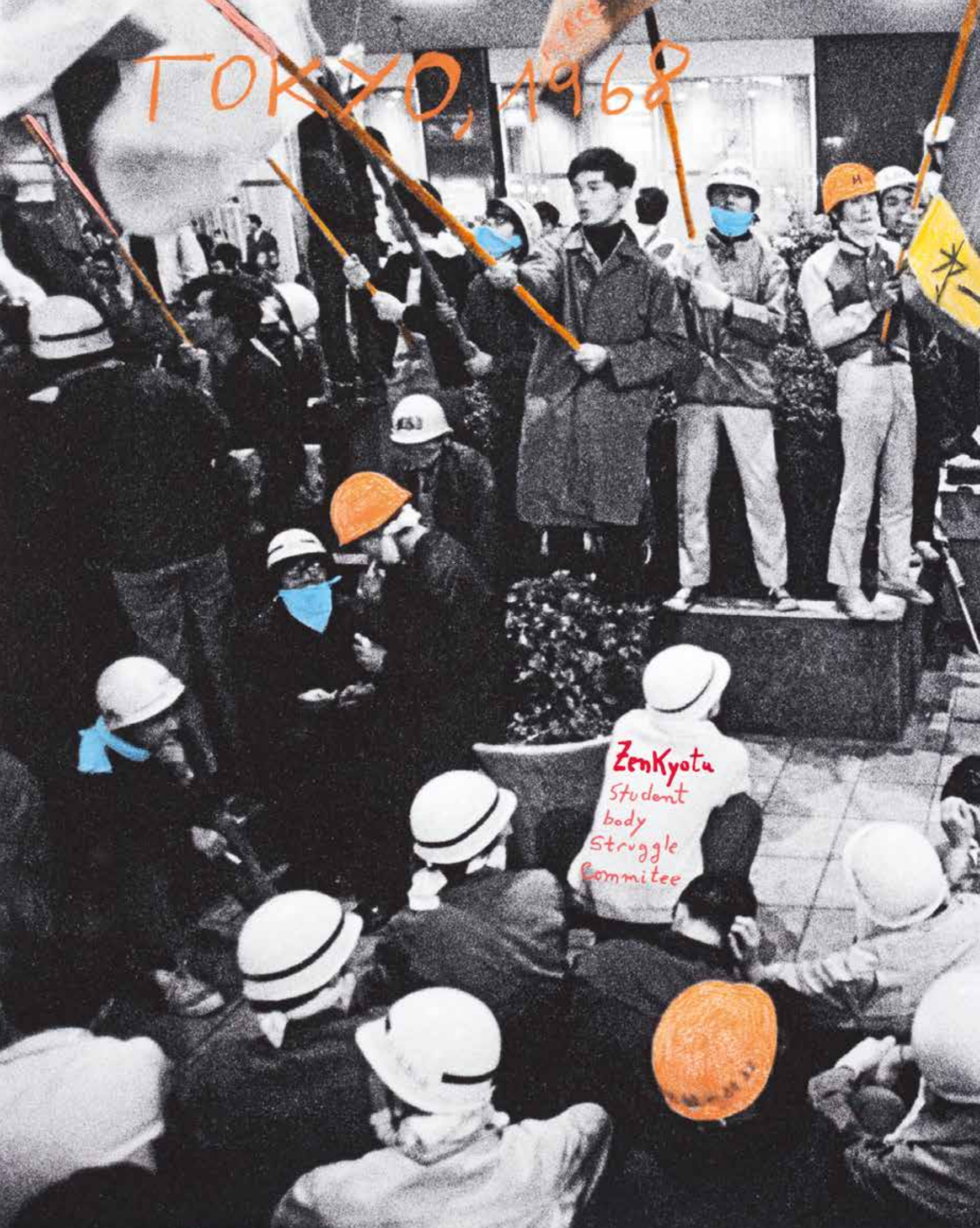
In October 1968 the student body struggle Committee (ZENKYOTU) organized an unified action against 4.5 million people participated in the movement in Japan. 1968