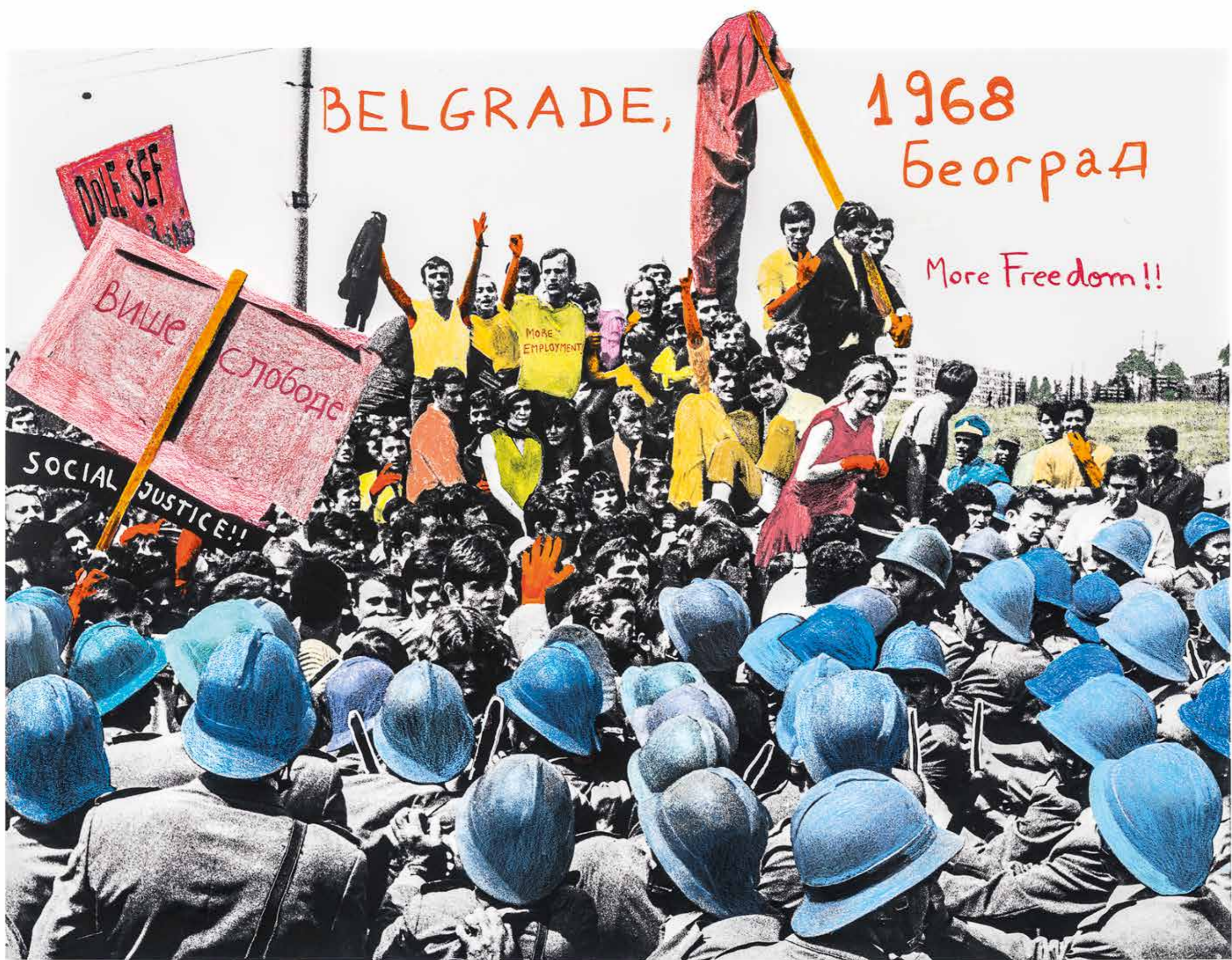
The first mass protest after the Second World War was held by Belgrade students on the night of June 2nd 1968. Police beat the students and banned all public gatherings. The protests for more freedom and for social justice were supported by prominent public personalities as film director Dušan Makavež, stage actor Stivo Zijer and University Professors. Protests also broke out in other capitals of the Yugoslav republics, Sarajevo, Zagreb and Ljubljana. Students asked for a solution for the employment problem, many graduates had to go abroad for lack of opportunities at home.