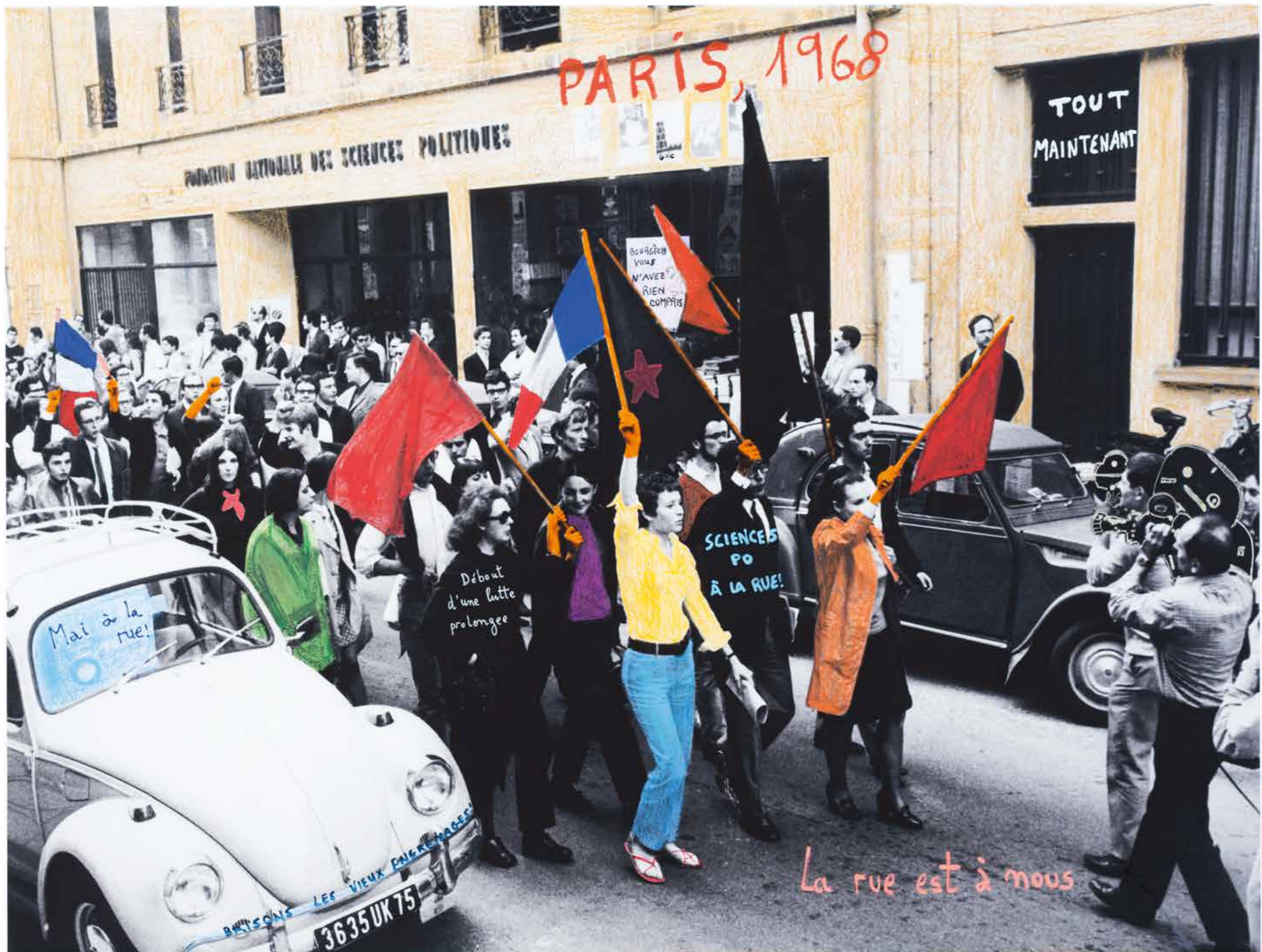
Mai 68 est d'abord un mouvement de révolte étudiante et sociale sans précédent, né du malaise latent au sein de l'université et la société française. La révolte étudiante y débouche sur des grèves et une crise sociale généralisée. 1968 Le feu des idées 6/7 Marco Brodsky